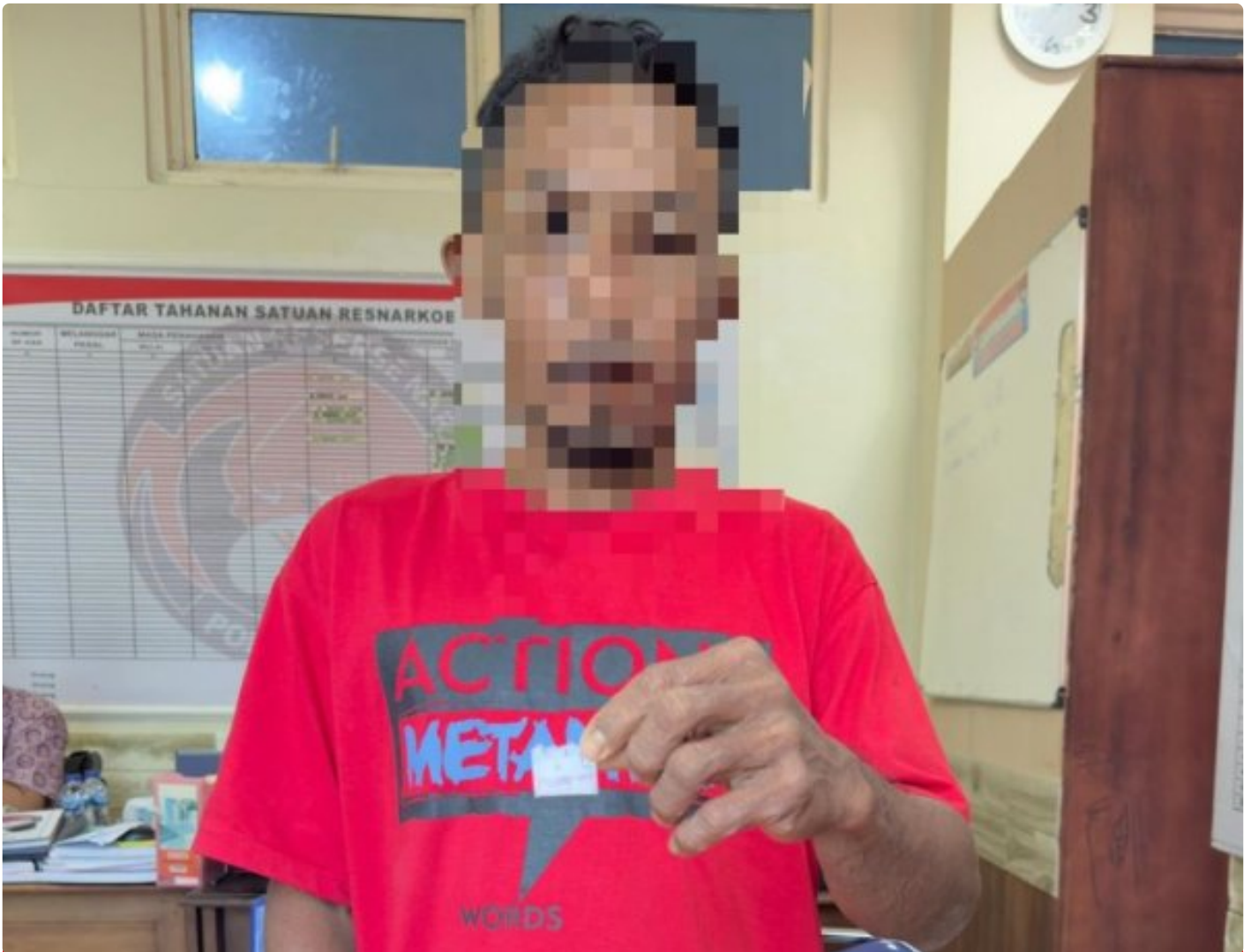
Pelaku Penyalahgunaan Narkotika jenis sabu diringkus dari Desa Lele